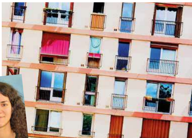
Logements et institutions peuvent influencer les conditions de vie des personnes âgées.

Intitulé « Staging Age », la série d'événements théâtraux s'inspire du projet de recherche « HomAge » dirigé par Tania Zitoun, professeure dans ce même institut. On y explore à quelles conditions certains modes de logement, structures et institutions permettent aux personnes